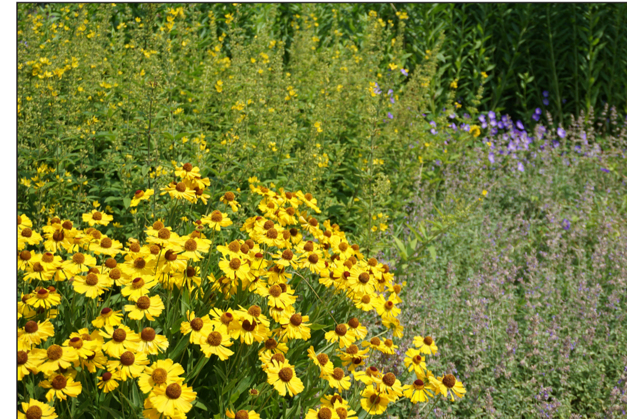
Vaste planten combinaties met kleurrijke bloei