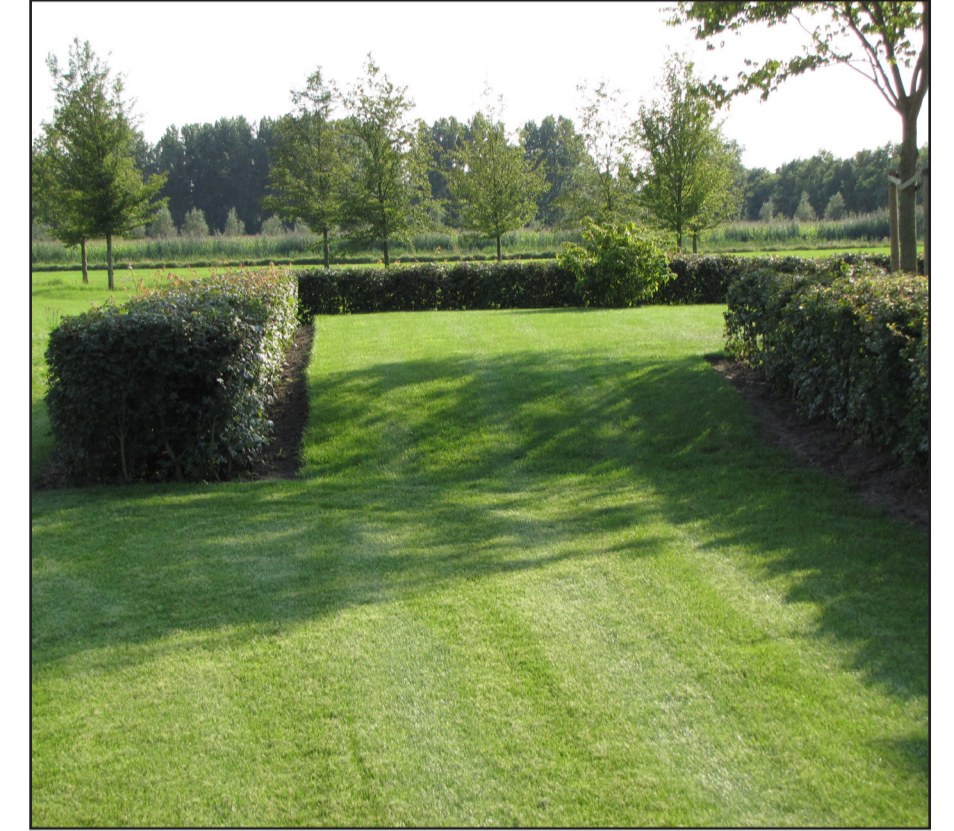
Strakke hagen in gazon