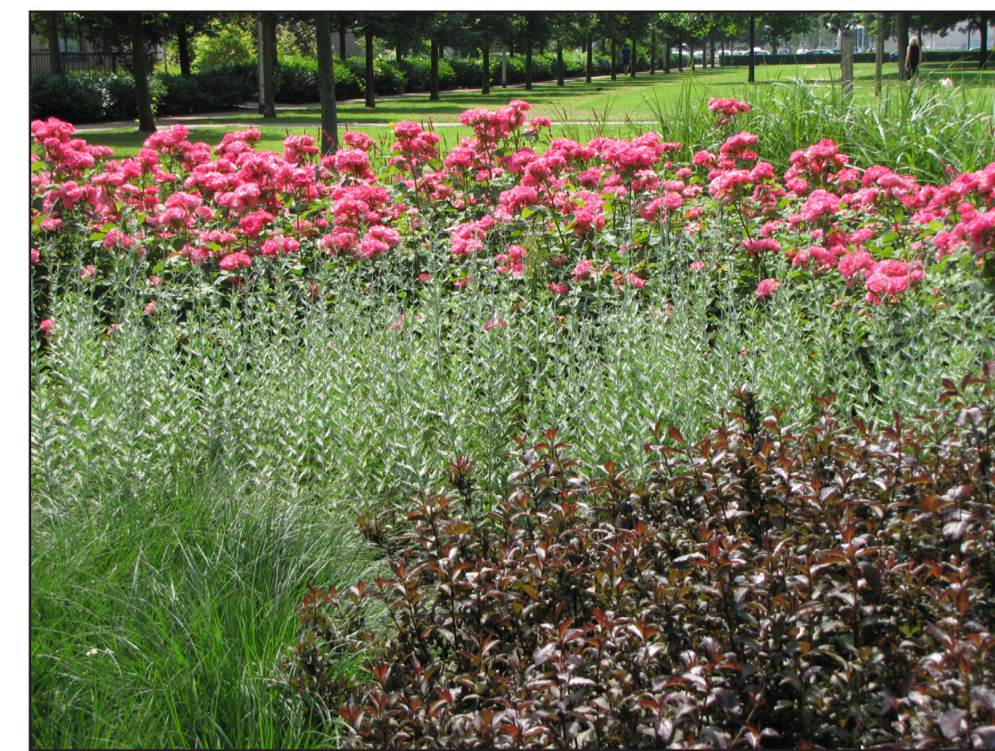
Mix van sierheesters