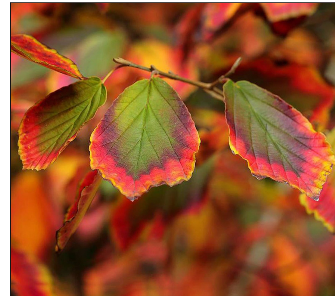
Bomen met een opvallend herfstbeeld